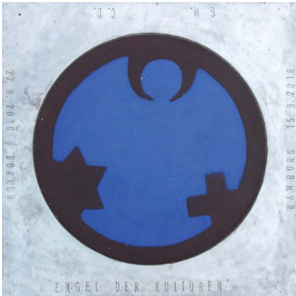
Bodenintarsie Engel der Kulturen

Das Kunstprojekt Engel der Kulturen des Künstlerpaars Carmen Dietrich und Gregor Merten fördert seit 2008 durch Aktionen im öffentlichen Raum interkulturelle und interreligiöse Begegnungen von unterschiedlichen Gruppen in der Gesellschaft. An der Aktion beteiligt werden Schulen, christliche Kirchen, muslimische und jüdische Gemeinschaften in Deutschland und europaweit.