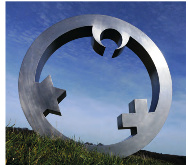
Interreligiöses Kunstprojekt: „Engel der Kulturen“