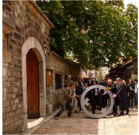
Sarajevo/ Bosnien Herzegovina