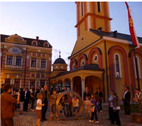
Dubica/ Bosnien Herzegovina