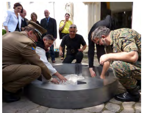
Militärgeistliche in Banja Luka