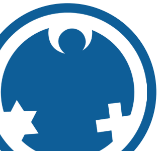
Oliver Quilling Landrat des Kreises Offenbach